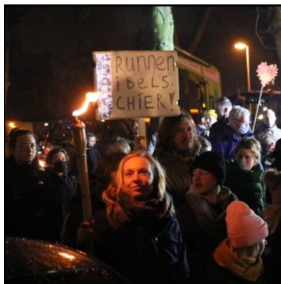
De fakkeltocht in Stad op 15 januari 2022.